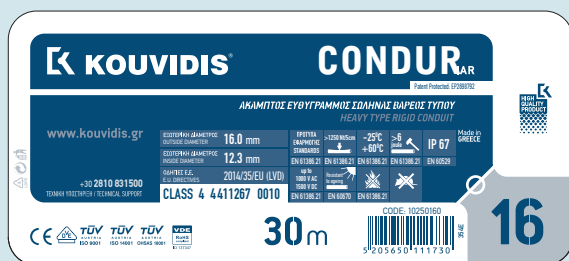
Eticheta este aplicată pe fascicule sau colaci de tuburi

Toate produsele KOUVIDIS sunt prevăzute cu etichete distinctive aplicate pe ambalaj și sunt ușor de urmărit. Culoarea etichetei indică tipul produsului, în timp ce informațiile menționate se referă la caracteristici și la rezistența mecanică.